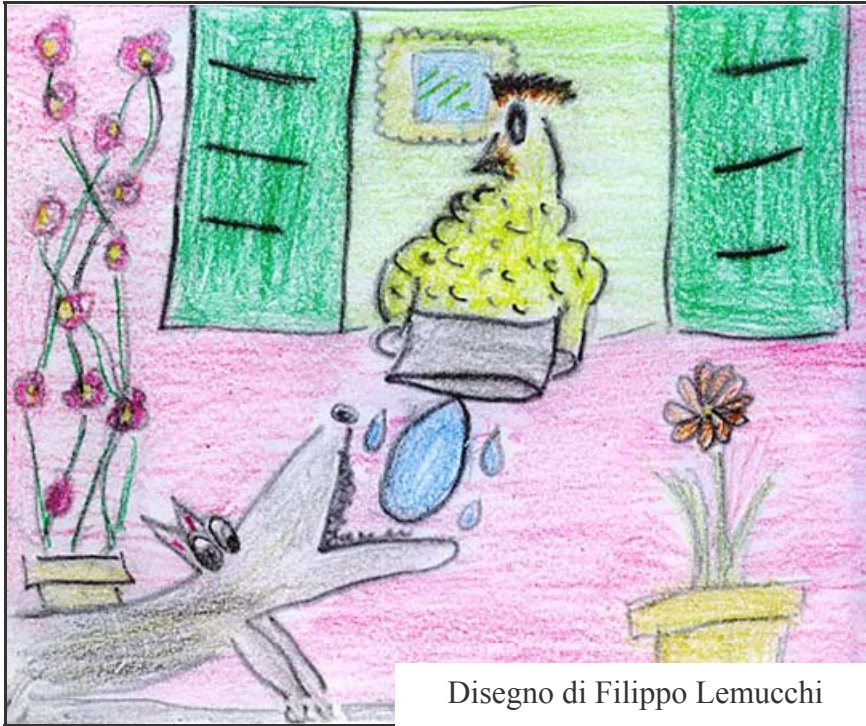
Disegno di Filippo Lemucchi