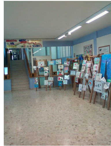
La Mostra di Pittura sull'Unità d'Italia