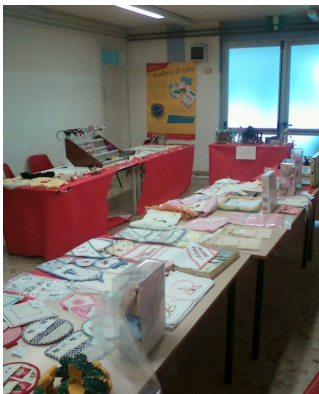
Il mercatino di beneficenza dell'IC Gereschi di Pontassierchio