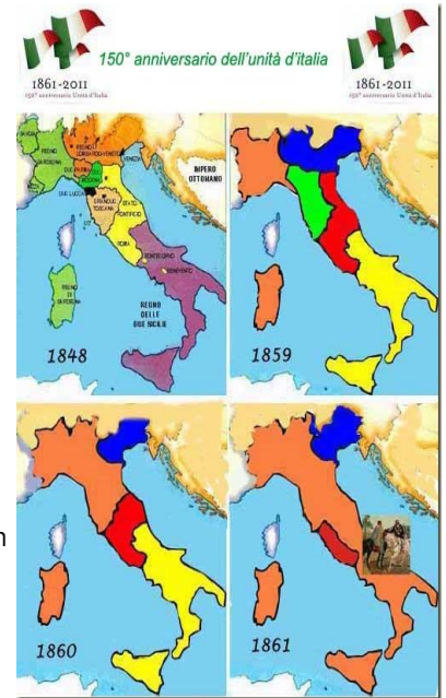
Le fasi del Risorgimento

La prima questione si risolse nel 1866, quando l'Italia con l'aiuto della Prussia sconfisse l'Austria e annesse a sé Veneto e Friuli Venezia-Giulia. La conquista di Roma avvenne nel 1870 in seguito alla Breccia di Porta Pia. Roma divenne la nuova Capitale d'Italia. (Victoria Neamtu e Andrea Basile III B)