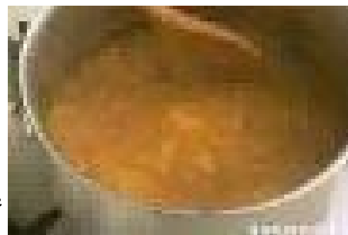
La cosiddetta "Sbobba"

Dopodiché ci rechiamo verso la mensa, SPERANZOSI di trovare cibo gradevole, ma quando ci avviciniamo alla mensa c'è sempre lei.....l'addetta alla mensa....che purtroppo ci tiene in serbo solo 2 frasi: "Non è ancora arrivato il cibo!" oppure "Preparatevi c'è solo la solita brodaglia", che nel nostro gergo è "La SBOBBA". Di secondo invece ci sono di solito due cose: la carne con verdure o il pollo con le patate. Ma a dire il vero, siamo stufi di mangiare le stesse cose! Vogliamo più qualità e soprattutto...varietà di cibo! Un pasto "bello" che almeno soddisfi la quota pagata dai genitori degli alunni. Dopo il presunto pranzo, facciamo ricreazione fino alle 14.00. Nella ricreazione si fa un po' di casino: corriamo, giochiamo, scherziamo. Da poco abbiamo incominciato a giocare con una pallina. E poi parliamo di tante cose e ridiamo a crepapelle Al suono della campanella, dobbiamo entrare a scuola perché stanno per iniziare i laboratori.